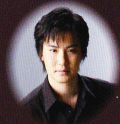
イエス/バス：駒田敏章